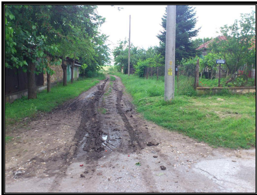
Участъка след ул. "Дунав"