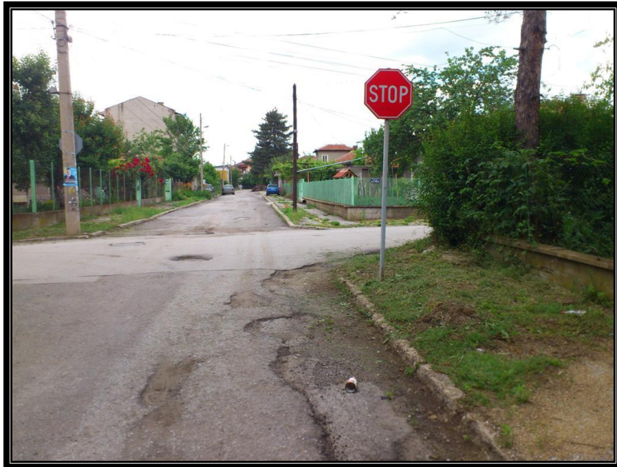
Кръстовище с ул. Оборище