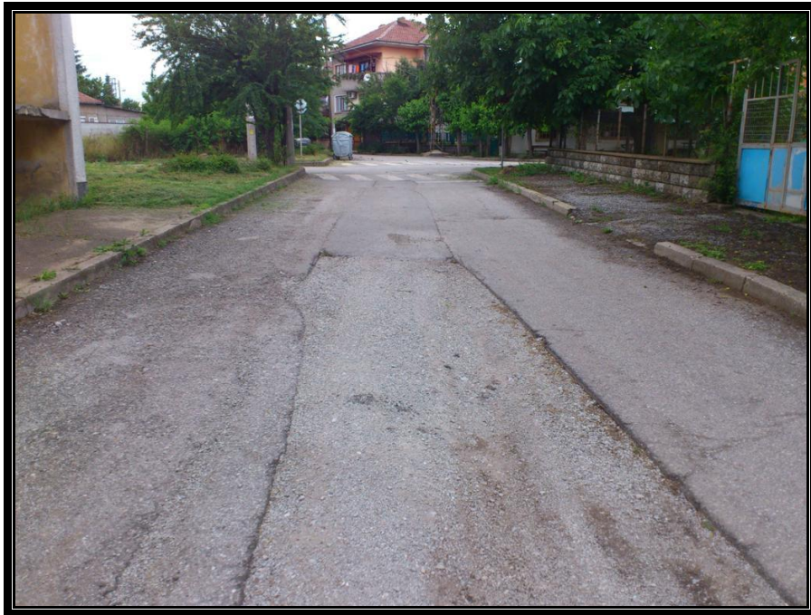
Участъка от ул.Руен към ул.Оборище