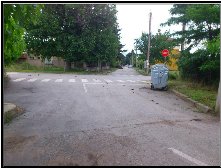
Кръстовище с ул. „Руен”