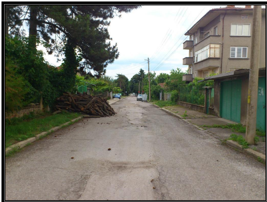
Участъка от ул.Оборище към ул.Руен